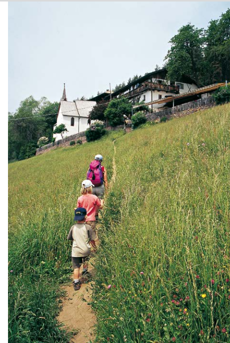
Die letzten Meter zum aussichtsreichen Berggasthof Bad Siess.

entnommen aus dem Rother Wanderführer Bozen – Kaltern von Dumler · Hirtleiter · Hüsler ISBN 978-3-7633-4444-4