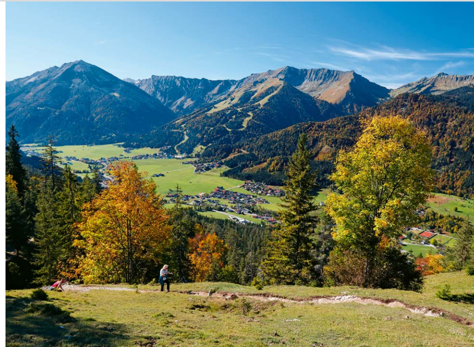
Allein für diesen Bilderbuch-Ausblick lohnt sich der Aufstieg.

Karten: Freytag & Berndt 1:50.000, Blatt 321. AV-Karte 1:25.000, Blatt BY14.