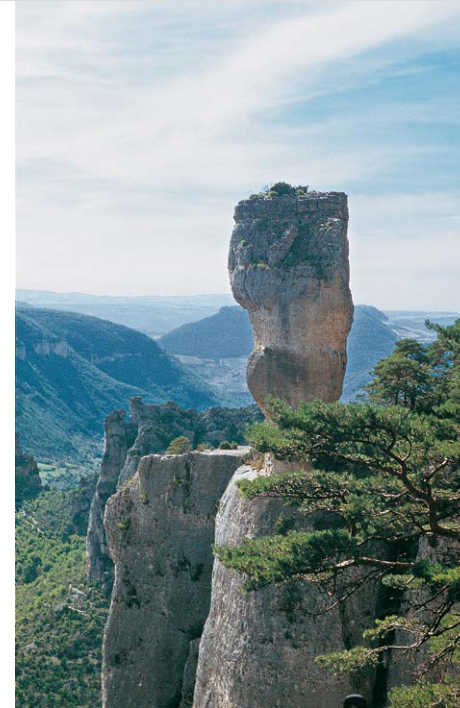
Felsformation der Vase de Chine.

Weg. Hier besteht bei einem Wasserhahn die letzte Möglichkeit auf dieser Tour, Trinkwasser nachzufüllen. Der schnell steiler werdende Weg ist nun gekennzeichnet (gelb, grün und weiß-rote Markierung des GR 6). An einigen Häuserruinen zweigen wir nach links zum Rocher de Capluc ab, der links von uns thront. Wer ihn erklimmen möchte, sollte trittsicher und frei von Höhenangst sein, da die Metallleitern in der oberen Hälfte des Aufstiegs zwar in den Felsen verankert sind, aber ansonsten frei stehen. Wir erreichen das Gipfelkreuz des Rocher de Capluc (2) nach gut 45 Min. ab Le Rozier, je nach Andrang an den Leitern. Der weite Blick über die Schluchten des Tarn und der Jonte ist tatsächlich einmalig, denn von keinem anderen Punkt sind beide Schluchten gleichzeitig einsehbar. Für den Abstieg ist derselbe Weg einzuschlagen wie beim Aufstieg und nach etwa 15 Min. sind wir wieder am Fuß des Rocher de Capluc angelangt.