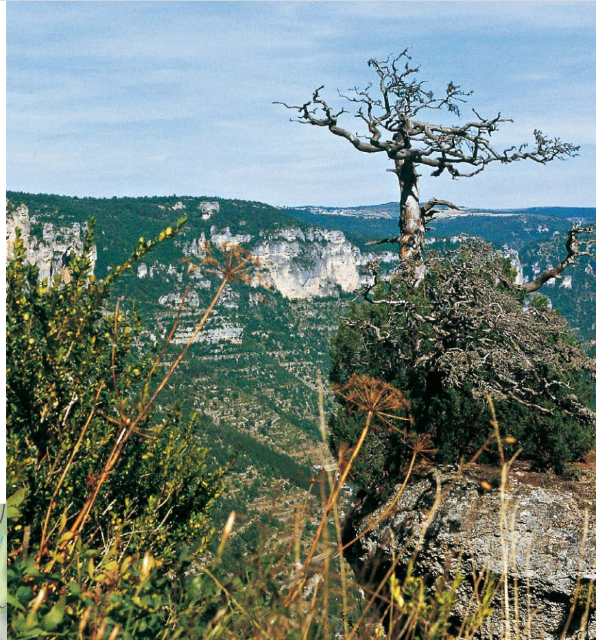
Blick über die Jonteschlucht.

Im weiteren Verlauf folgen wir geradeaus diesem abschüssigen Pfad und ignorieren zwei nach rechts abzweigende Wege. Der zweite Abzweig ist der Sentier J. Brunet (3) , den wir bereits vom Anstieg her kennen. Wir wandern weiter geradeaus auf dem Hauptweg und sind nach gut 1 Std. ab der Vase de Sèvre wieder beim Abzweig am Fuße des Rocher de Capluc angelangt. Auf dem bekannten Weg erreichen wir unseren Ausgangsort Le Rozier (1) .