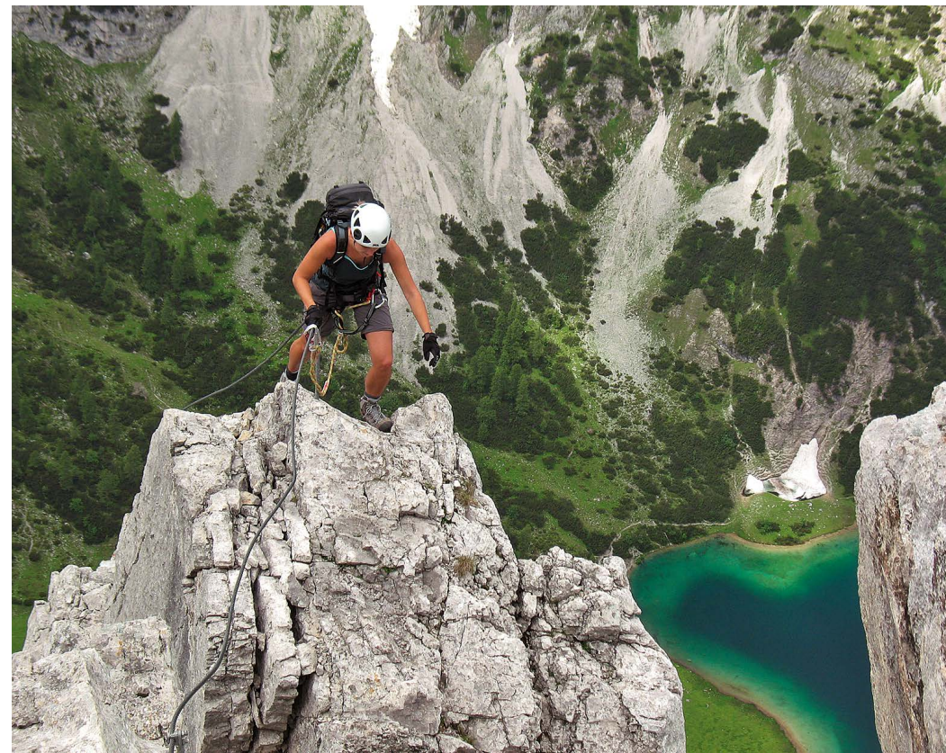
An der Westkante des Vorderen Tajakopfs – tief unten der Seebensee.

KS5-D; Wandhöhe ca. 600 m, spärliche Tritthilfen, z. T. extrem exponiert