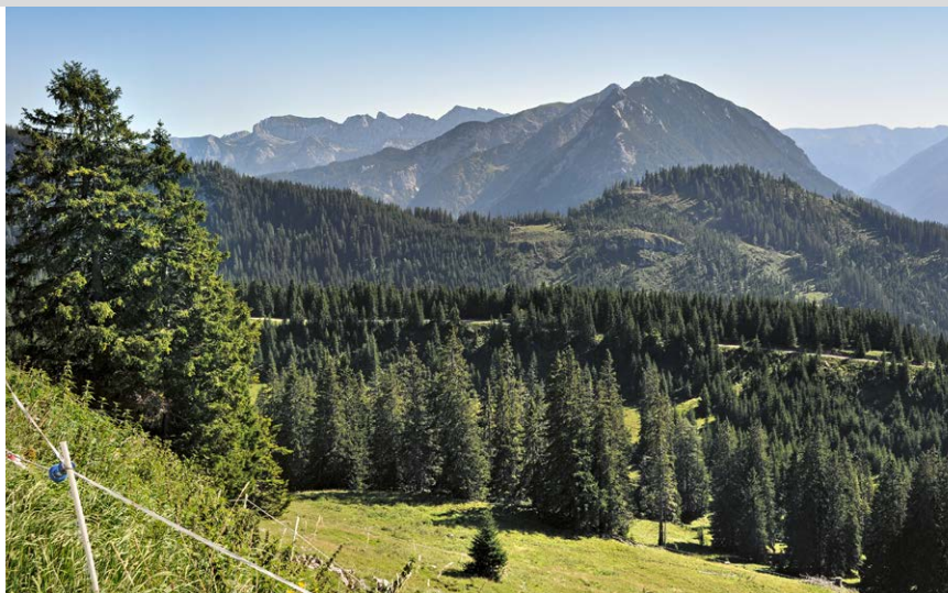
Blick auf den Guffert und den Rofan dahinter.

Tipp: Wer in Achenkirch zwei Übernachtungen einplant, kann die nächste Etappe mit leichtem Gepäck ge-