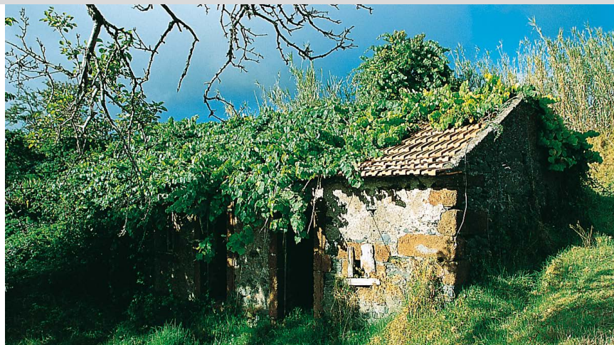
Was der Mensch aufgegeben hat, holt sich die Natur Stück für Stück zurück – an der Levada Nova.

Nach einer gemütlichen Dreiviertelstunde auf der Levada verschwindet diese unter einer Teerstraße. Wir gehen 6 m links die Straße aufwärts und treffen wieder auf den Kanal. 20 Minuten darauf wird in Raposeira do Lugarinho (6) eine Straße erreicht (links befindet sich eine Bar mit zugehörigem Tante-Emma-Laden). Die Levada läuft hier durch einen Privatgarten. Wir folgen der Straße rechts für 10 m und umgehen dann das Haus mit dem Garten. Knapp 10 Minuten nach Raposeira quert die Levada die alte Landstraße und schwenkt ins Tal der Ribeira da Cova. In Maloeira werden kurz hintereinander zwei Straßen gekreuzt (auf der