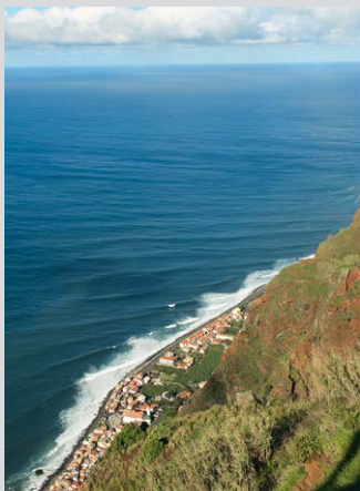
Tiefblick auf Paul do Mar.

queren eine Straße und halten uns links auf dem Teerweg (Caminho S. João) weiter aufwärts. Dieser geht nach ein paar Minuten in die Rua Prof. Francisco Barreto über. Von links mündet die Rua das Eirinhas ein, wir gehen weiter geradeaus. Immer auf dem Teerweg bleibend wird eine halbe Stunde nach der Kirche schließlich die Levada Nova (5) , 640 m, erreicht. Wir folgen dem schmalen Wasserkanal rechts entgegen der Fließrichtung. Die Levada schlängelt sich durch zwei Täler, Kulturland wechselt mit Kiefernwald und Farnwiesen.