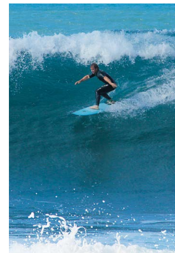
Wellenreiter vor Paul do Mar.

Für den Rückweg zum Hotel Jardim Atlântico kreuzt man die Hauptstraße und folgt dem Caminho Lombo da Rocha abwärts. An der Kreuzung an der Kirche (Einkehr dahinter im Teehaus der Quinta Pedagógica) hält man sich rechts in Richtung Hotel, an der Gabelung 4 Minuten darauf geht man ebenfalls rechts. Das Sträßchen führt am Restaurant Olhar do Campo vorbei und schwenkt am Restaurant Saloio nach rechts zum Hotel Jardim Atlântico (1) .