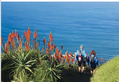
Abstieg nach Paul do Mar.

Vom Hafen in Paul do Mar (2) gehen wir auf dem parallel zum Meer verlaufenden betonierten Dorfweg durch den Ort zur Kirche und kurz nach dieser auf der Uferstraße weiter. Unterhalb der vor allem am Wochenende bevölkerten Surfbar Maktab gibt es eine kleine Mole, von der man bei ruhiger See ins Meer steigen kann, oft ist das Meer hier allerdings den Wellenreitern vorbehalten. Kurz nach