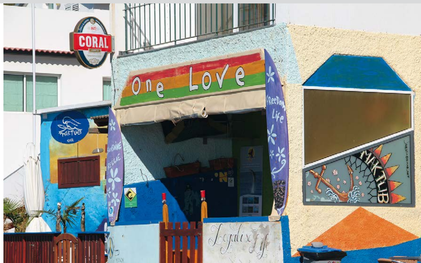
Szenetreff in Paul do Mar.

dem Szenetreff wird am Aparthotel Paul do Mar (3) vor einer kleinen Brücke die Uferstraße rechts in die gepflasterte Vereda dos Zimbreiros verlassen. Nach 75 m queren wir auf einer Bogenbrücke die Ribeira das Galinhas. Der Weg führt zwischen zwei Häusern hindurch. Es folgt nun ein langer steiler Aufstieg durch eine anspruchslose Küstenflora mit Opuntien und Agaven. Am Aussichtspunkt , 314 m, an dem alten Förderband bietet sich eine Atempause an, hier fällt das Kap senkrecht zum Meer ab. Über uns können wir schon die Kirche von Fajã da Ovelha sehen. 10 Minuten nach der Aussicht wird eine Teerstraße gekreuzt, wir steigen halb rechts auf der schmalen Dorfstraße (Caminho do Massapez) ins Dorf auf. Die Straße geht in eine steile Betonpiste über. Wir treffen auf ein quer verlaufendes enges Teersträßchen, dem wir rechts hinauf zur Kirche folgen. Am Kirchplatz von Fajã da Ovelha (4) , 460 m, steigen wir ein paar Stufen auf, über-