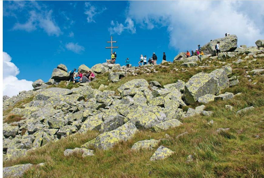
Auf dem Gipfel des Ďumbiers herrscht bei gutem Wetter immer großer Andrang.

(3) ist der Weg zum Ďumbier zunächst rot und grün markiert und zieht sich links unterhalb am Hang des höchsten Bergs entlang. Wir queren kleinere Geröllfelder und steigen an der Verzweigung Rázcestie na Krúpové sedlo (4) rechts nach oben zum Krúpové sedlo (5) auf. Ein steiniger Weg, der mit rotem Dreieck gekennzeichnet ist, bringt uns in knapp 30 Minuten zum höchsten Berg der Niederen Tatra – dem Ďumbier (6) . Eine fantastische Aussicht lohnt für den etwas mühevollen Aufstieg und mit etwas Glück sind die seltenen Tatragämsen zu sehen, von denen es heute nur noch wenige Hunderte Exemplare gibt.