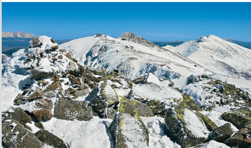
Blick vom Dereše zum Chopok und Dumbier.

(10) neben der Seilbahnstation vorbei zum nächsten Berg. Vom Wegweiser »Dereše« (11) erfolgt später der Abstieg. Etwas weiter oberhalb und knapp unter dem Gipfel befindet sich rechts vom Weg ein Steinmann (12) . Links davon gelangen wir über Blockwerk an ein etwa 10 Meter langes Band und steigen dort recht einfach zum kleinen Gipfelplateau des Dereše (13) auf. Unter Umständen werden die Hände an einer Stelle zum Festhalten benötigt. Auf demselben Weg erfolgt der Abstieg bis zum Wegweiser »Dereše«. Wir wechseln hier auf einen gelb markierten Pfad, der einen alten Skilift kreuzt. Eine markante Felsformation dient im weiteren Verlauf als Orientierungshilfe. Nach dem großen Stein folgt ein längerer und steiler Abstieg mit mehreren Serpentinaen zum Sedlo Príslop (14) . Nahezu ohne großen Höhenunterschied verläuft unser Weg jetzt nach links am Hang entlang und bietet kurz hinter dem Wegweiser »Odbočka na Chopok« (15) nochmals traumhafte Aussichten auf den Dumbier. An der Mittelstation – Medzistanica (16) – biegen wir nach rechts ab und steigen auf einem Pfad am linken Rand der Skipiste hinab. Ein steiler Abschnitt wird im Wald mithilfe einer weiten Schleife umgangen. An der ersten Verzweigung führt ein schmalerer und ziemlich bewachsener Weg zur Piste zurück. Direkt an der Parkgarage befindet sich die Bushaltestelle Hotel Srdiečko (17) . Die hier beginnende Asphaltstraße bringt uns in wenigen Minuten zum Ausgangspunkt Trangoška zurück.