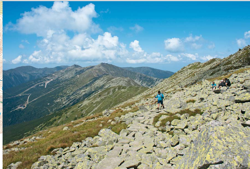
Aufstieg zum Dumbier.

Wir steigen vom Gipfel bis zum Sattel und von dort auf dem rot markierten Kammweg in westliche Richtung bis zum Demänovské sedlo (7) auf angelegten Steinweg ab. Jetzt folgt ein längerer Anstieg mit Querung einiger kleiner Geröllfelder. Der Ausblick nach Norden auf das einsame Seitental ist fantastisch. Rechts hinter der Kamenná chata (8) beginnt ein schmaler Steinpfad, der uns in etwa 5 Minuten in Serpentinaen auf den Chopok (9) bringt. Auf selbem Weg geht es zur Hütte zurück und am Wegweiser »Chopok«