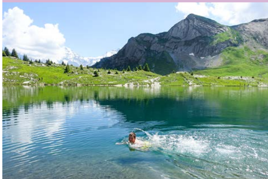
Ein Bad im Sulseeewli ist für viele der Höhepunkt der Wanderung.