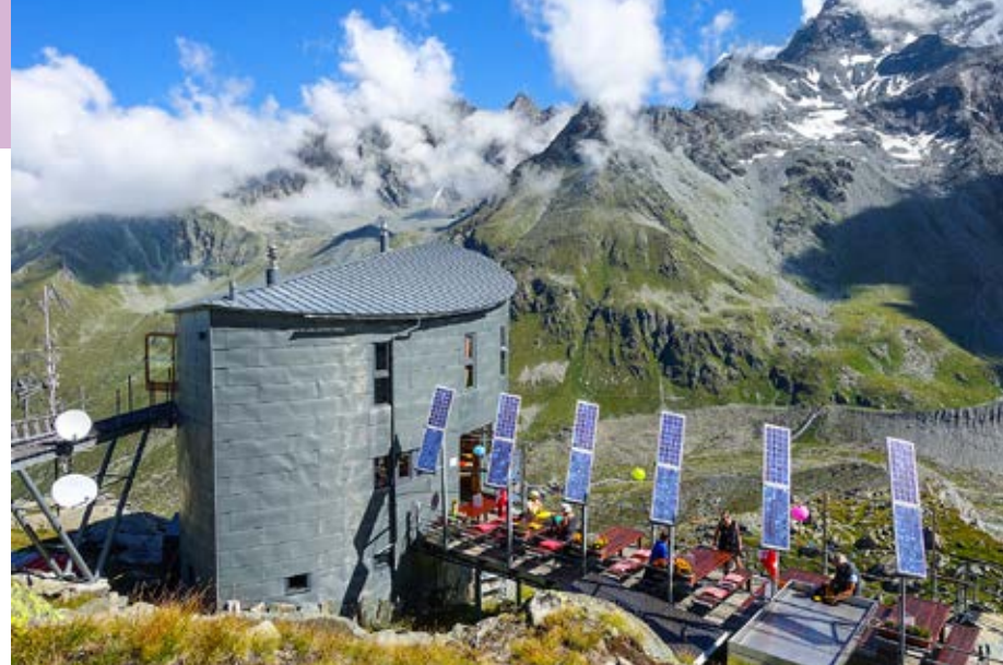
1993 eingeweiht: Die futuristische Cabane du Vélan der Sektion Genevoise setzte beim Hüttenbau innerhalb des SAC neue Massstäbe.

Parcours entlang des Hüttenwegs, Begrüssungstee, Kinder bis vier Jahre essen und schlafen gratis