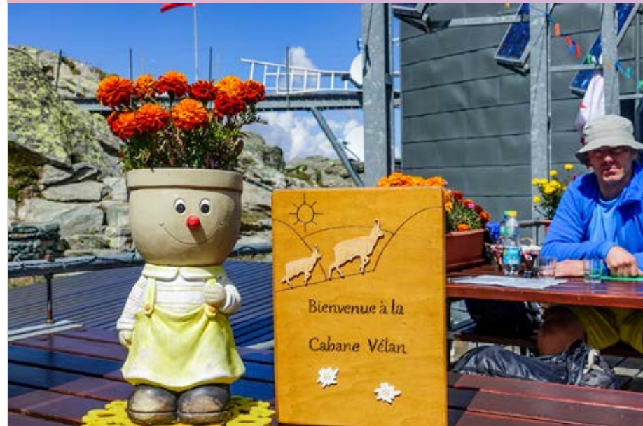
Mit Liebe für Details: In der Cabane du Vélan fühlen sich grosse und kleine Gäste wohl.