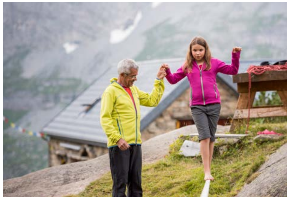
Für Jung und Alt: Slackline bei der Kröntenhütte.