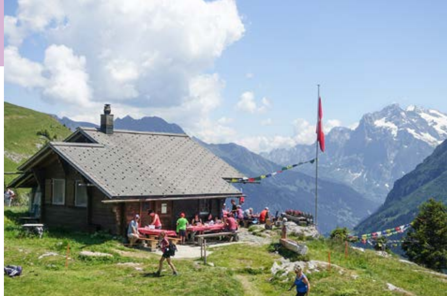
Beliebtes Ausflugsziel im Lauterbrunnental: die Lobhornhütte der Sektion Lauterbrunnen.

Aussicht auf Berner Bergriesen, Sulseeewli, Kinder bis zwei Jahre essen und schlafen gratis