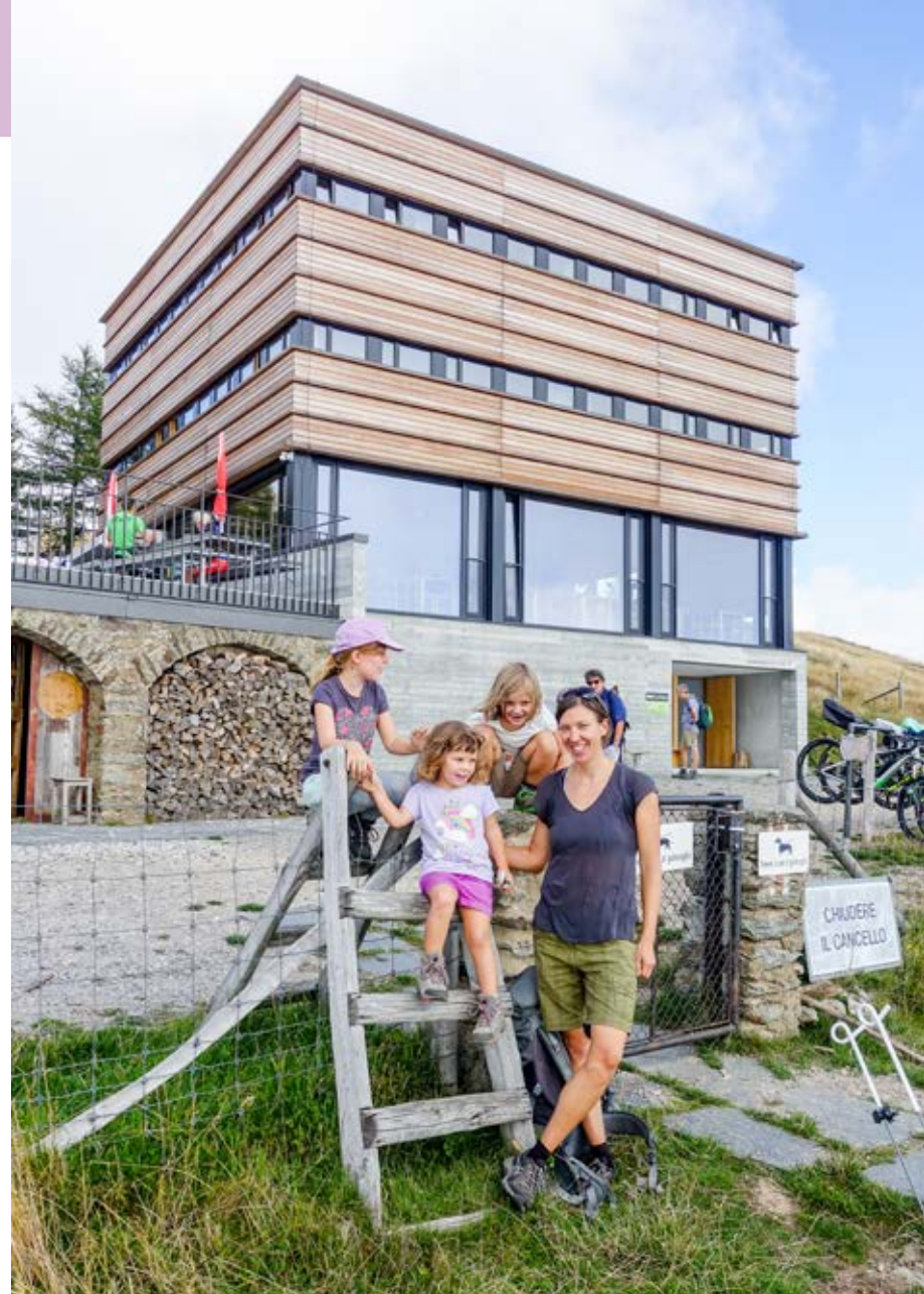
Die Autorin mit ihren Kindern bei der Capanna Monte Bar.