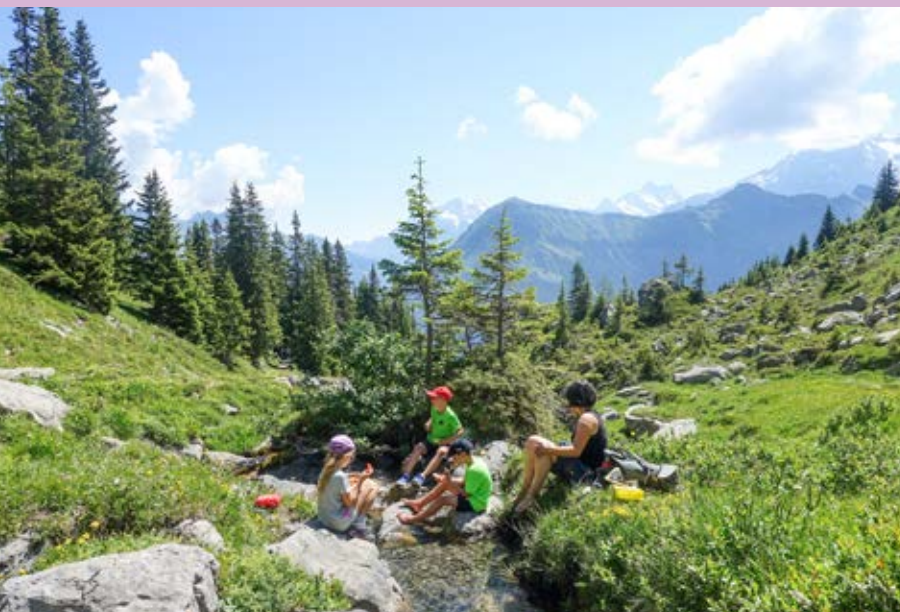
Ein schöner Ort für eine Pause: der Sulsbach kurz vor der Alp Suls.