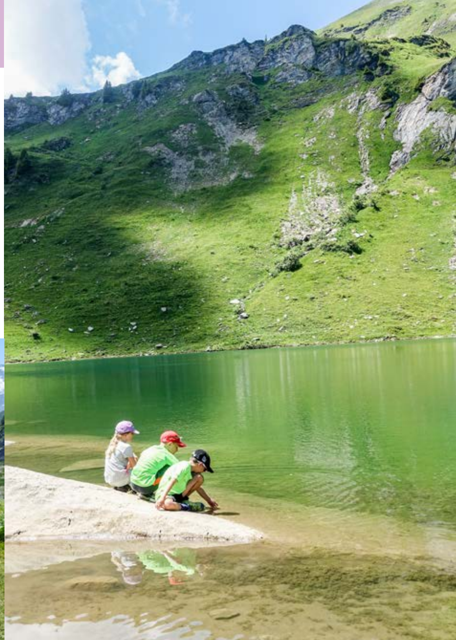
Im Sulsseewli kannst du Fische und Kaulquappen beobachten.